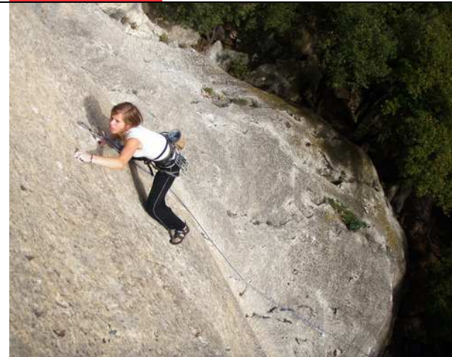
Eowyn dans Le voyage de l'incrédule 6B