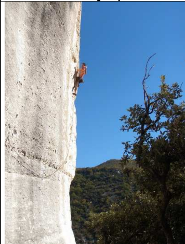
Igor dans No man's land 7B