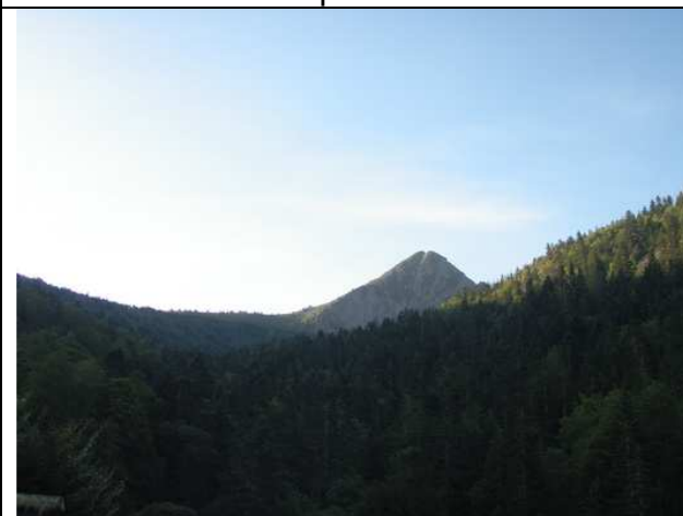
La dent d'Orlu