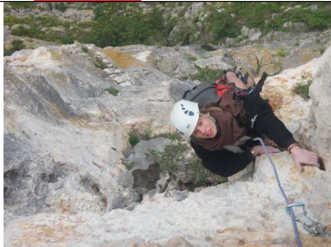
Eowyn dans la Capucin (2 ème longueur)