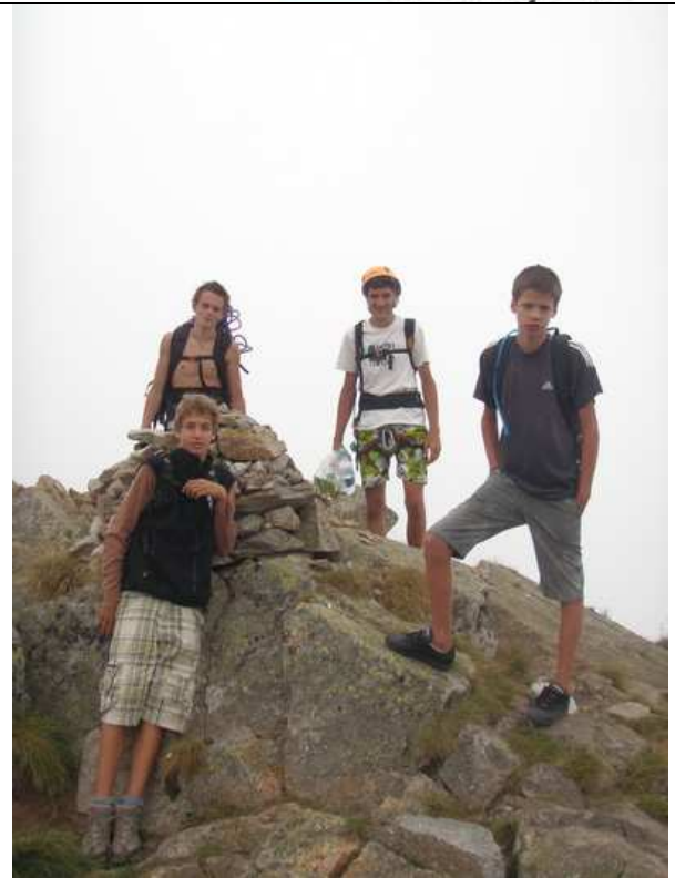
Le groupe au sommet de la dent d'Orlu