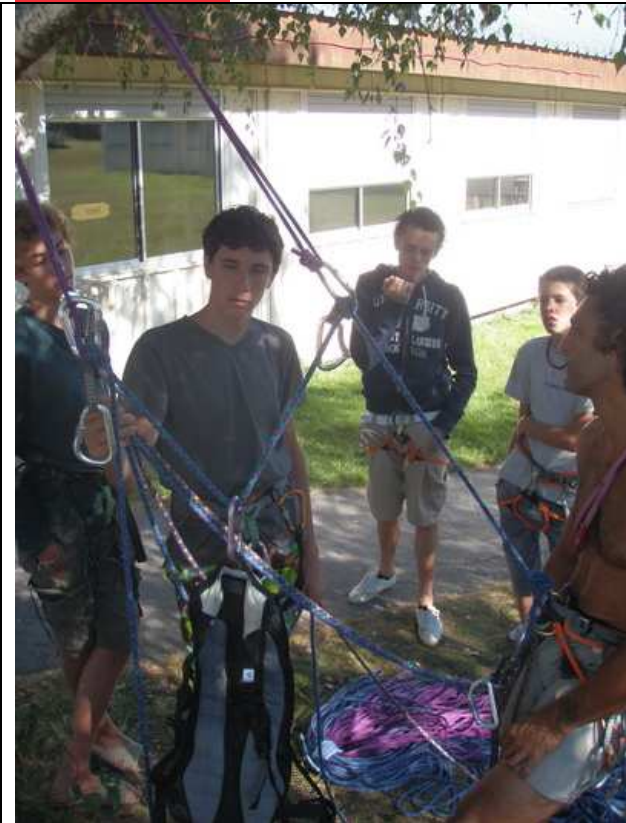
Révisions des manip