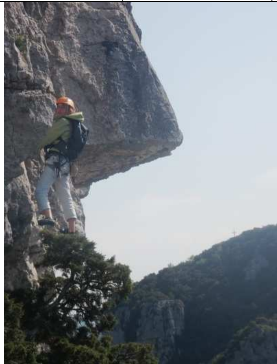
Marie dans le Capucin (dernière longueur)