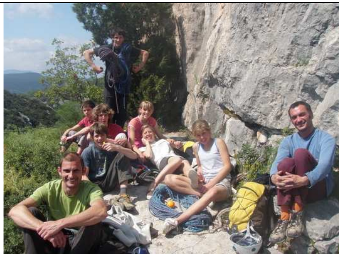
Le groupe ravi des premières expériences en grande voie

Le deuxième stage : du 26 au 29 août Lieu : Dent d'Orlu