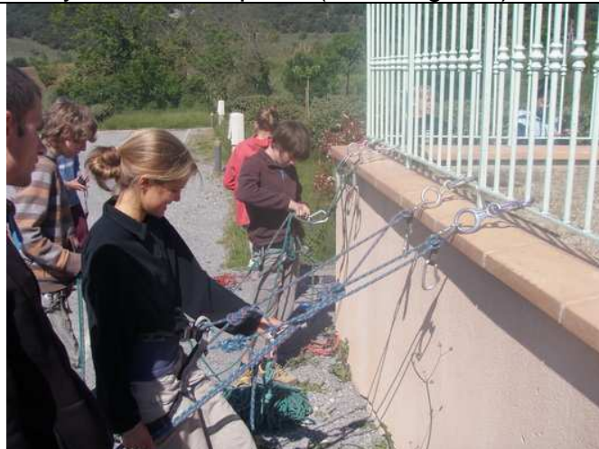
Travail des manipulations au relais